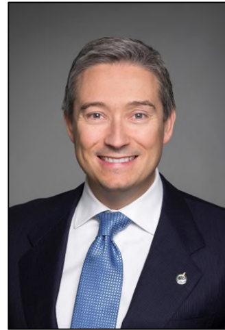
L'honorable François-Philippe Champagne Ministre de l'Innovation, des Sciences et de l'Industrie

Nous vous invitons à lire ce rapport pour en savoir plus sur les nombreuses réalisations du Canada dans le domaine spatial en 2022-2023 et sur la façon dont le portefeuille de l'ISDE