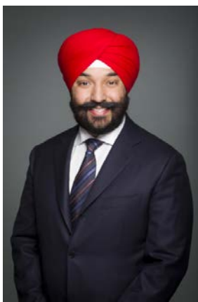
L'honorable Navdeep Bains Ministre de l'Innovation, des Sciences et du Développement économique

J'ai le plaisir de vous présenter le Plan ministériel de l'Agence spatiale canadienne pour 2018-2019.